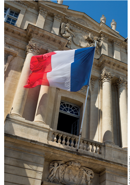
Article extrait de Jurisassociations n° 739 du 15 mai 2026. Reproduction interdite sans l'autorisation de Juris éditions © Editions Dalloz – www.juriseditions.fr

L'objectif initial du législateur paraissait louable puisqu'il s'agissait de limiter les risques d'emprise séparatiste dans le monde associatif 16 . Toutefois, les premiers bilans de ce dispositif ont malheureusement démontré qu'en pratique, cet objectif a été largement détourné.